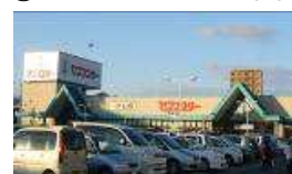
⑱セブンスター 三津店