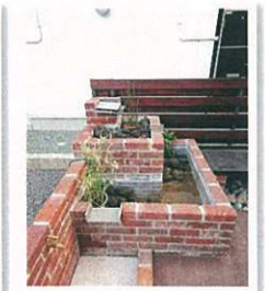
無添加住宅モデルハウス