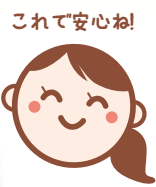
これで安心ね! 柱脚は金物を使用

玄関底を支えていた化粧独立柱と玄関引戸横の腰壁(板壁)が腐食していたので、取替えをしました。柱は檜、腰板は杉 羽目板を使用。以前の柱はそのまま土間タイルに埋め込まれていましたが、今回は柱脚の金物を使用して柱の足元をなるべく水に浸からないようにしました。