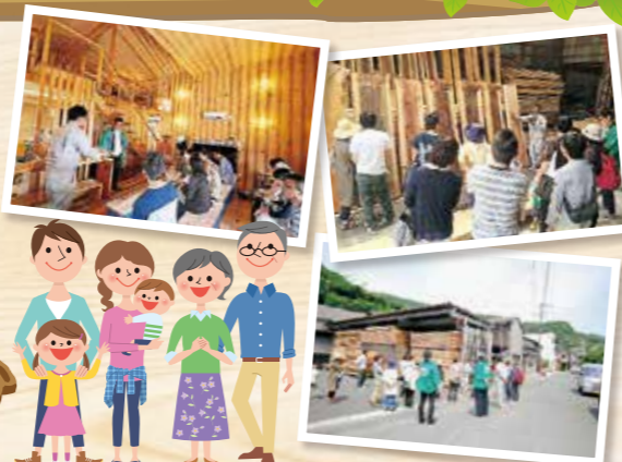
本社工場・事務所 愛媛県西宇和郡伊方町二名津