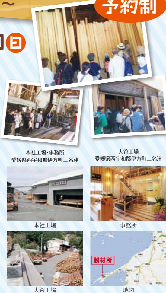
本社工場・事務所 愛媛県西宇和郡伊方町二名津