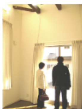
後ろからこっそりパチリ。