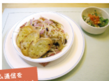
オリジナルメニューの ピリ辛パスタ 750円