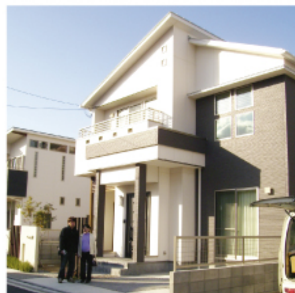
みのりの家に一言、「Y様をしっかりと見守っていいね」

をしてもらいました。奥様のお父様もその様子を収めようと、ずっとビデオカメラを回していらっしゃり、とても微笑ましかったです。もうすぐお子様も誕生ということで、夢いっぱいのY様。