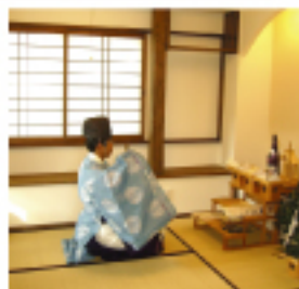
終わったあとのお塩やお酒はみんなに振舞ったり、お料理なんかで使いましょう。