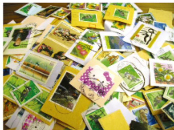
わずかな期間でこれだけ集まりました!

おそらくその女性も、もともとご自分で古切手を集めていらしゃったんだと思うのですが、早速みのりホームに届けてくださいました!ご協力ありがとうございました!