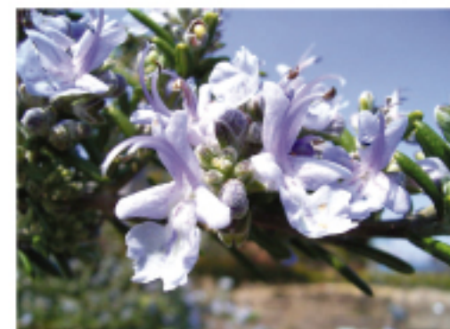
ローズマリー Rosemary 新緑(しそ)科の ハーブ