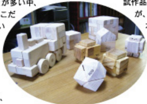
小さなミニロボット、傘などの小さいものから、赤ちゃん列車などの高さなものまで様々

「ある方がおっしゃったんですが、多く普及しているプラスチックのおもちゃに比べて、木でできているおもちゃは壊れやすい。でも乱暴に扱ったら壊れるという事を知ること、物はもちろん人に対しても、大切にやる心や力加減を自然と学び取れるのではという言葉をお願いしたんです。なるほどなぁと思いました。それに木のおもちゃは壊れたらまたくっつけばいいですしね。」