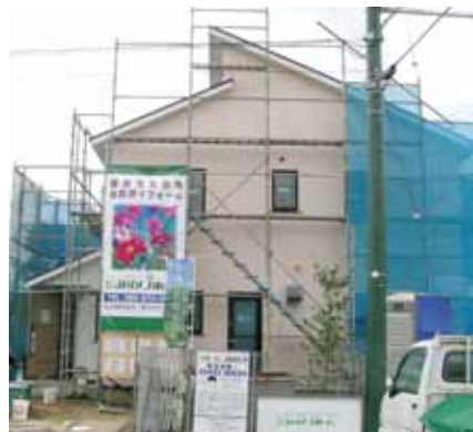
「開閉吹き抜けのある家」が完成しました。ホームページにアップしていますので、よかったら見てみてください http://www.minori-group.com/

順調に工事が進み、もう間もなく完成します。こちらの家は完成見学会を7/10・11に行ないますので、私たちとお施主様が心をこめて建てた家がたくさんの方に見て頂ければ嬉しいです。