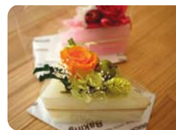
製作予定の作品です。

日 時: 8月8日(水) 午前の部 10:30~ 午後の部 13:30~ 場 所: ECOとセキュリティのまち ていれぎ モデルハウス内 (松山市高井町) ※上記の地図をご覧ください。