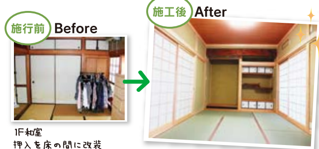
1F和室 押入を床の間に改装

2人暮らしになり、使わなくなった2F子供部屋の間仕切りを撤去しアトリエと寝室に改装しました。 扉を引きこめば、広々とした空間になります。 1F和室と広縁の間仕切りも撤去してワンルームに。 明るく、解放的な空間になりました。