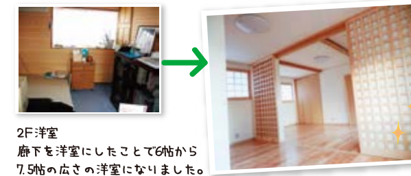
2F洋室 廊下を洋室にしたことで6帖から7.5帖の広さの洋室になりました。

2人暮らしになり、使わなくなった2F子供部屋の間仕切りを撤去しアトリエと寝室に改装しました。 扉を引きこめば、広々とした空間になります。 1F和室と広縁の間仕切りも撤去してワンルームに。 明るく、解放的な空間になりました。