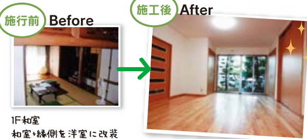
1F和室 和室+縁側を洋室に改装