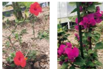
(ハイビスカス) (ブーゲンビリア)