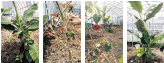
(スーパーミニバナナ) (ホワイトサポテ) (ピタンガ) (アイスクリームバナナ)

やわらぎでは社長の余暇利用としてビニールハウスで{アイスクリームバナナ・スーパーミニバナナ・ジャポケカバ・ホワイトサポテ・ピタンガ}などの南国フルーツを育てています。